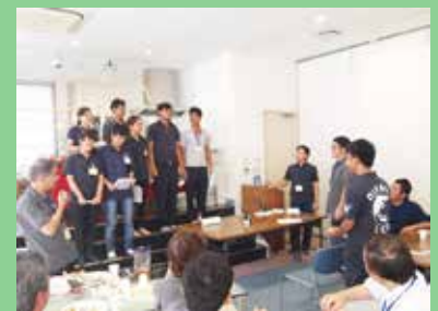
残る研修生から送る言葉。感動しました。