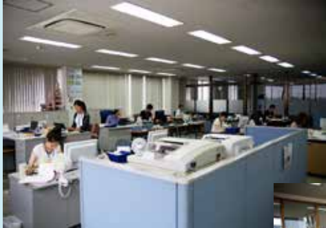
事務所も雰囲気が変わって、より華やかになった感じがです

2. 5次産業を目指す上でまずは会社の雰囲気を変えてみようとして作業する服装から変革する試みです。