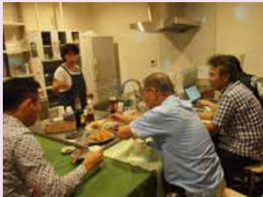
ママの手料理に 箸がすすみます。