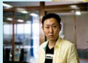
ファッションリーダー君臨！！ 代表です。