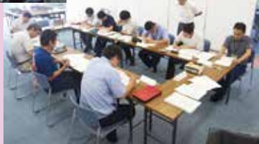
トレーナーの課題に真剣に取り組中