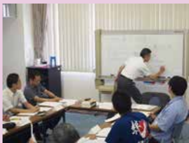
井上トレーナーも 熱が入っています