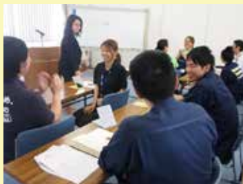
お互いのロールプレイング