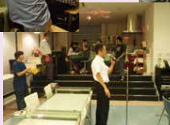
社内とは思えない雰囲気を演出しています。