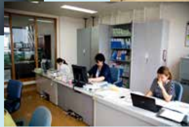
逆に身が引き締まり作業効率も上がっている感じがです

御来社頂きましてありがとうございます。 本日は当社では私服デーを実施しております。 お客様には、軽装での接客、ご面談となるかと存じますが 何卒ご理解ほどよろしく願いいたします。