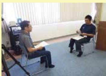
社長を相手にロールプレイング