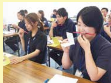
みんなで笑顔の練習中