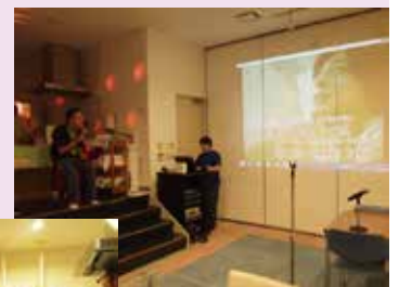
大型スクリーンでカラオケ。 大好評です。