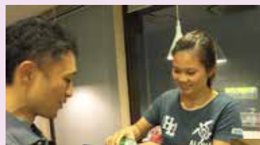
お酌してもらって 思わず顔がほころびます