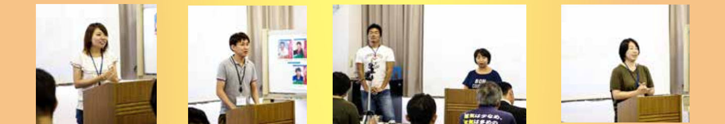
応援演説。候補者に負けずに気合が入っていました