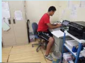
夏はクールビズです。