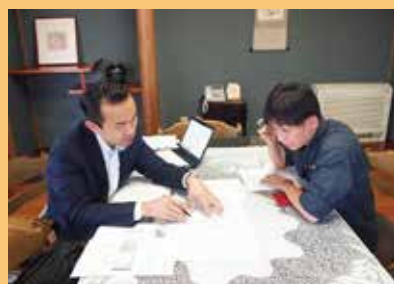
個別での課題指導中