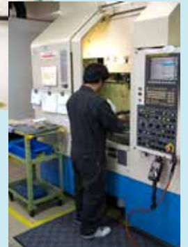
ユニフォームも自分で考えて決められます