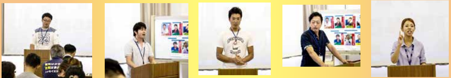
候補者演説。各自の色が出ていて、力説の中に心に響くものがありました