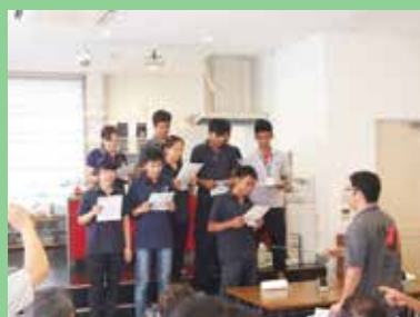
ドディット君も交えて「ふるさと」を合唱。 心に沁みました。