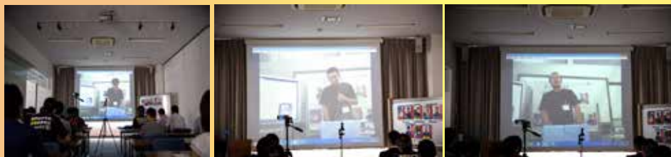
藤沢-那須間をSkypeで繋ぎ、生中継しました