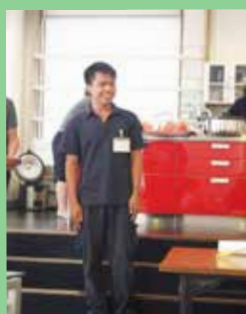
卒業するドディット君。 3年間よく頑張りました。