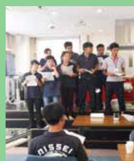
ドディット君(手前)に捧げる「乾杯」を合唱。