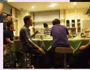
カー通勤の方にはノンアルコールを用意しています。