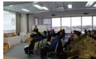
今期スローガン「初志貫徹」意味の説明