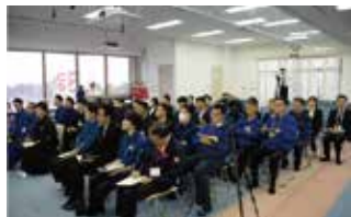
各自部署の成績と総評をしていただきました