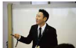
今後の事業計画、事業ビジョンの説明