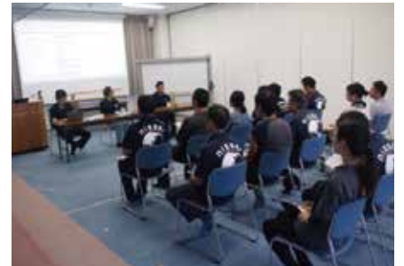
◎クロージングミーティング