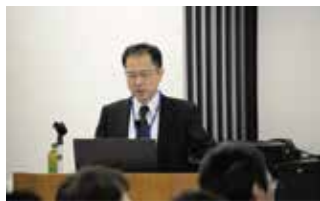
42期の振り返りと43期目標説明