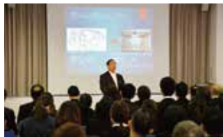
IT化・新事業への思いを説明