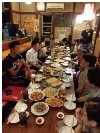
ボウリング後の食事会