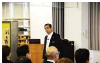
今後の進む道！！ニッセイエコの社員として考え方の指導