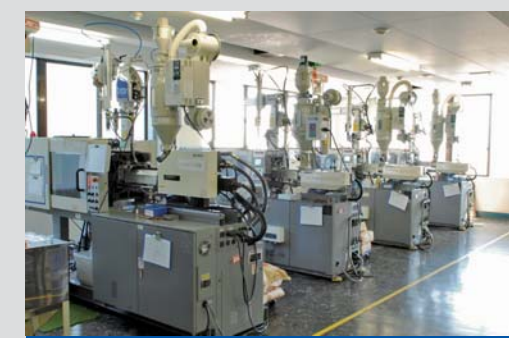
電動射出成形機を有し成形技能士が高品質を作り出します。