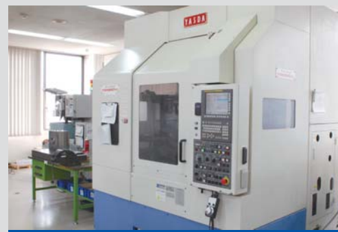
マシニングによる金型製作 最新の機械、CAD/CAMの活用と経験からくるノウハウを融合して精度の高い金型を製作します。