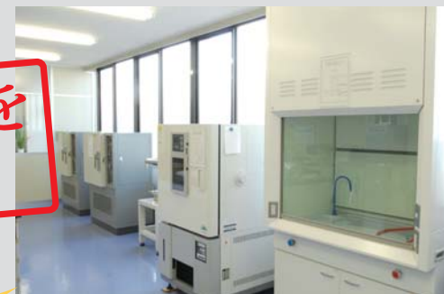
JIS, ISO, UL規格に準じた試験設備で自社材料、製品を評価。お客様に安心して使用して頂ける商品開発に取り組んでいます。