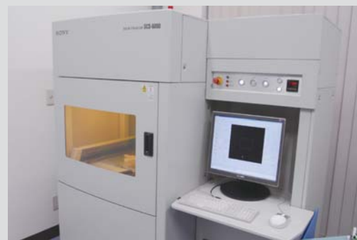
光造形による試作 3Dデータにより実際に形として具現化でき、設計確認形状確認に威力を発揮します。