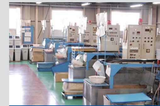
ディップ成形は、隣接している弊社工場にて行います。(別棟)

モノづくりの極み! モノづくりの極み! 「すべてにこだわる」を尽くすと 最後は、「すべて自分で」に行き着く!