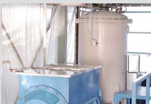
製品成形で使用する材料の製造は、隣接する工場で行います(別棟)