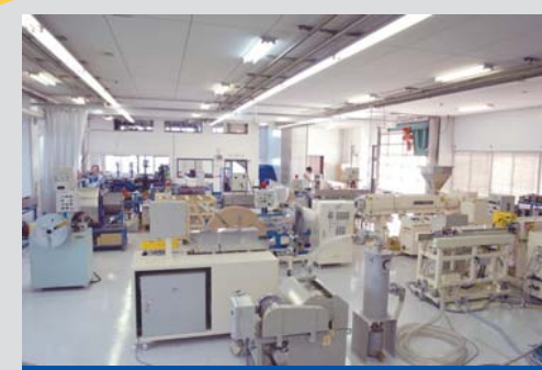
大型の装置、治具が必要な場合は、機械製造部で製作します。