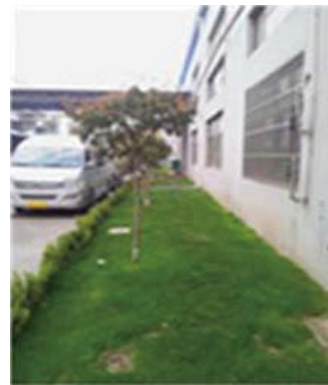
改善後、きれいな芝生でいっぱい！