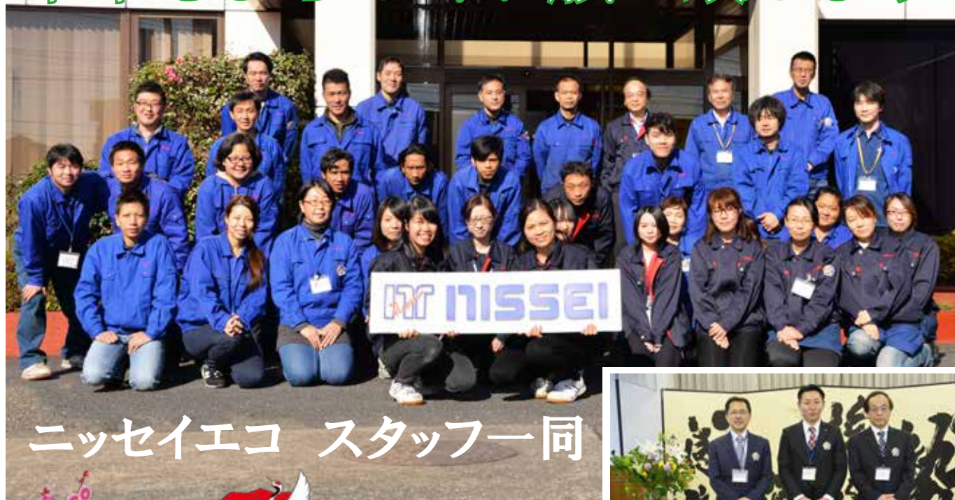
ニッセイエコ スタッフ一同