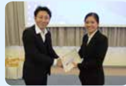
ベストパートナー賞 第四製造部 フェさん