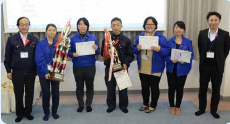
41期 QC 表彰者皆さん