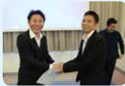
皆勤賞 第四製造部 ハイさん