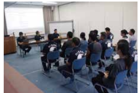
◎クロージングミーティング