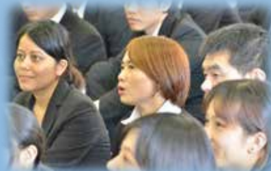
自分の国の国歌を口ずさんで