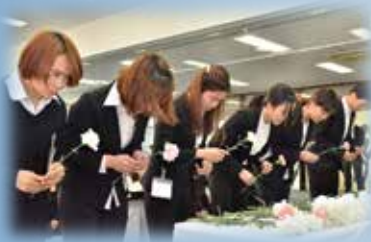
献花を行う外国籍の女性達。