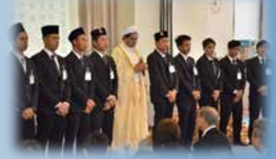
インドネシアの実習生たちも一緒に コーラン（経典）を唱えました。