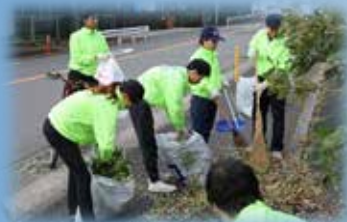
県道沿いもきれいに清掃しました。