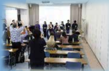
外国籍の社員だけで挨拶訓練を 実践しました。