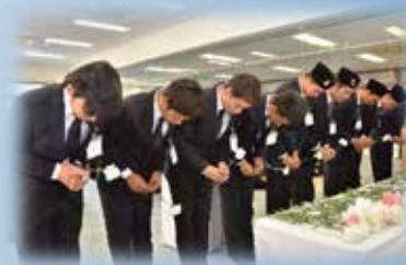
献花を行う実習生達。