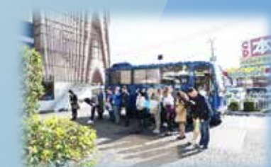
ロシアのみなさんも慣れない お辞儀で返してくださいました。 「ありがとうございました」