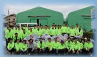
達成感で笑顔も自然とできました。 お疲れ様でしたー！！