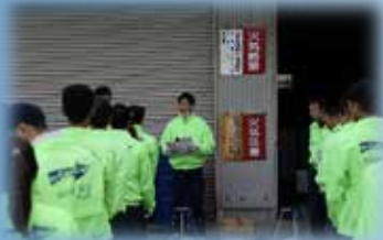
イベント開始前に注意事項を 聞きましょう！！