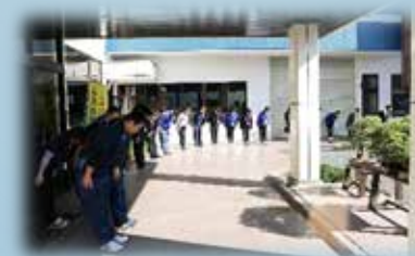
社員全員でお見送りしました。 「ありがとうございました」