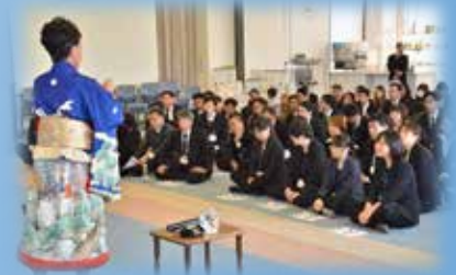
迫力のある歌声に圧倒されました。