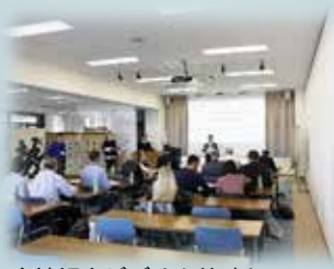
会社紹介ビデオを放映し、代表と社長からご挨拶をしました。