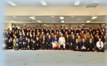
来賓の方々と一緒に全員で記念撮影。