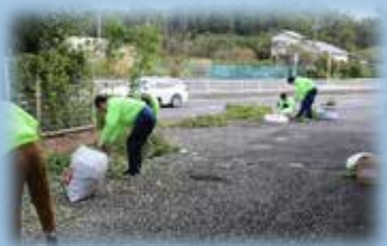
暗かった道も皆様のご協力が あって、明るくなりました！！