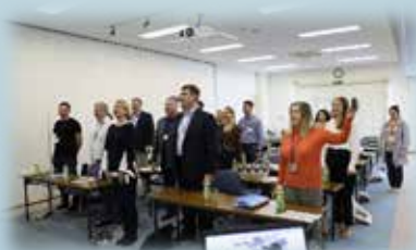
終了後、ロシア語で「ありがとう ございました！！」と大声で挨拶 してくれました。