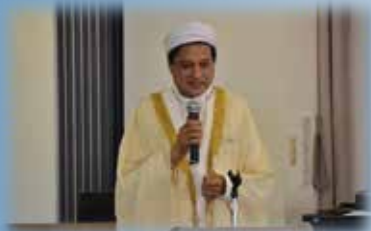
A.H.ムガール様にありがたいお話を していただきました。

弊社には、イスラム教のインドネシアの研修生がおります。イスラム文化に初めて触れることができ、イスラム教の経典に触れることができました。非常に良い経験となり、ニッセイエコならではの物故者慰霊祭になりました。