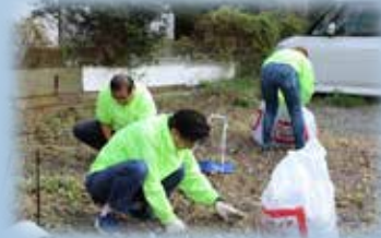
相談役も一所懸命！！いつも参加 いただきありがとうございます。