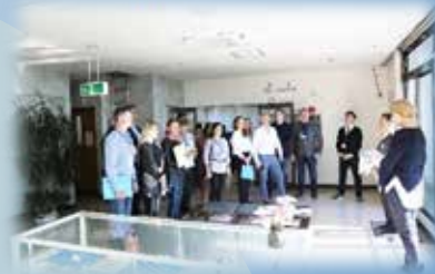
見学ツアー開始。新館3階フロアにて。掲示物にて弊社の取組みを説明しました。