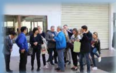
代表と社長でお出迎えました。

ロシアの方の見学会を通して、ニッセイエコ社員も良い経験をし、日本とロシアのみなさまと一緒に成長できれ幸いです！！ロシア人パワーに圧倒されました（笑）。