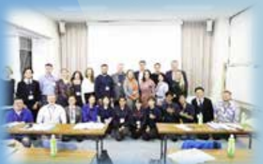
講習会に参加した全員で記念撮影。 素敵な笑顔をありがとうございます。