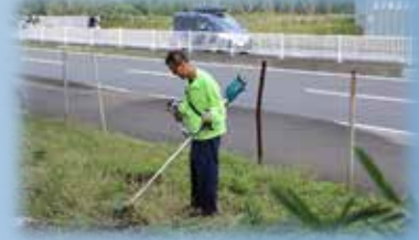
ニッセイエコの草刈りマスター！！ さすがです！！残さず刈りますよ！！