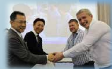
ロシア製のお菓子を土産でいた だきました。感謝の握手。