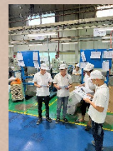
各班の作業前マニュアルの読み合わせ教育