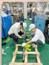
現場でのスクリーニング清掃教育