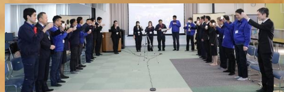
お屠蘇で清めました。年男女が声掛け