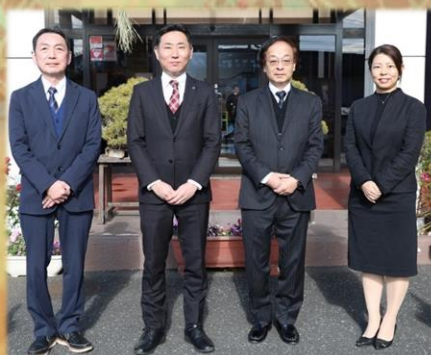
恒例の取締役撮影、今年は玄関前にて