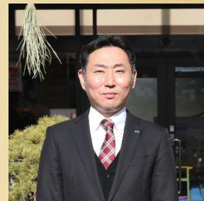
ニッセイエコ社屋玄関前にて

この度の能登半島地震により亡くなられた方々のご冥福をお祈り申し上げます。また、被災された皆様にお見舞い申し上げますとともに、一刻も早い復興がなされますよう、心よりお祈り申し上げます。