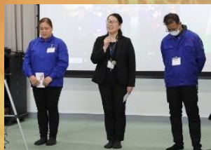
ご子息の成人式のお祝い