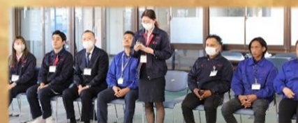
挨拶はちょっと緊張します