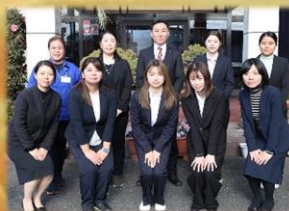
代表と女子社員で記念撮影