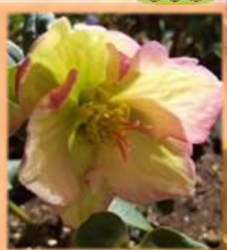
クリスマスローズ 鈴蘭スイセン