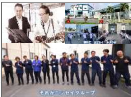
それがニッセイグループ

笑顔・挑戦・チームワーク～まずはやってみよう！～ 働きやすく笑顔あふれる会社でありニッセイエコのチームワークが良い事がよく分かり常に挑戦し続ける姿勢が伝わる動画です！