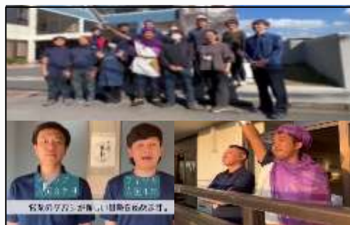
DIP冒険ダン、営業隆タカシの冒険

転職者・新卒の方々に向けた会社案内動画です。人を育て大切にしていける事がモノづくりに繋がっていることがよくわかる内容になっています！