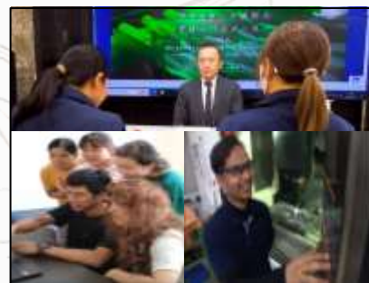
What is "NISSEI ECO"

社歌を通じて社員同士の結束力を高め創造性の促進と社内コミュニケーションを活性化させることにより、真心を込めた製品をお届けしている事が伝わる動画です！